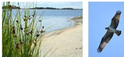
Region Sörmlands miljöarbete Vi arbetar för en god hälsa och miljö. Vår användning av kemikalier och läkemedel är hållbar.

Det finns en ny utbildning som alla förskrivare rekommenderas att genomgå (ca 20 minuter). Utbildningen är framtagen av enheten Miljö och klimat och Läkemedelskommittén. Utbildningen finns i Kompetensportalen , inloggning från intranätet.