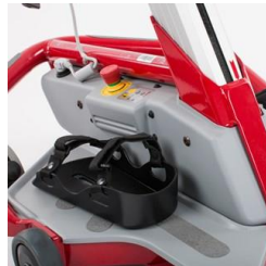
42274, 42275, 42276 Sandaler för fixering av fötter S/M/L par