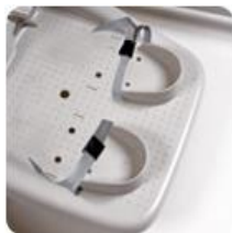
21715 Sabina hälstöd