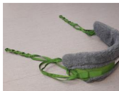
20624/33128 Polster till uppresningsväst (trygghetsväst) Medium/Large