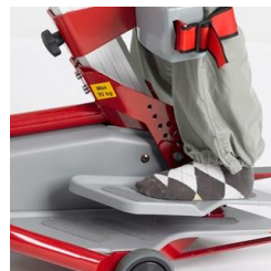
42273 Fotplatta höjddjusterbar, för barn el kort vuxen Monteras av tekniker. OBS! brukarvikt max 75 kg