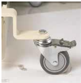
Art nr 32617 Lågbyggnadssats Lägsta/högsta höjd 24,5 cm/72,5 cm. Mobil personlyft kan inte användas.