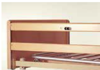
Art nr 19279 (par) Sänggrind Britt III trä fällbar Standardkomponent