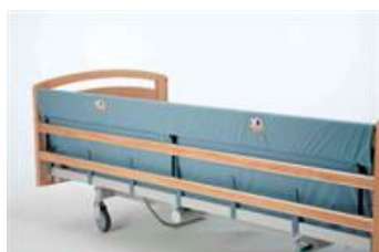
33069 (styck) Grindskydd förl +10-20 cm polstrat Passar Britt V och Line