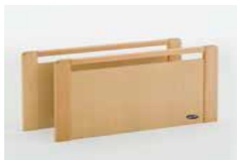
Art nr 36736 (par) Sänggavel Susanne sänkt 5 cm Standardkomponent