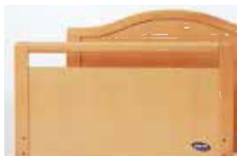
Art nr 31368 (par) Sänggavel Sanne sänkt 5 cm Standardkomponent