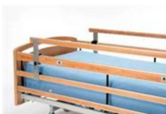
Art nr 33149 (styck) Grindförhöjning +15 cm Britt Passar till Britt III och V