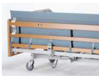
Art nr 35109 (styck) Grindskydd polstrat till sänggrind med grindförhöjning Passar Britt V och Line