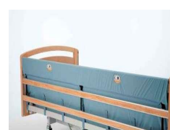
Art nr 41327 (styck) Grindskydd förl +5-10 cm polstrat Passar Britt V och Line