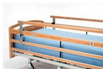
Art nr 34091 (styck) Grindförhöjning +15 till Line