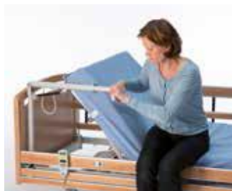
Art nr 36757 Uppresningsstöd 46 cm