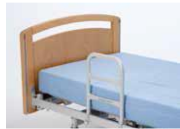
Art nr 36753 Stöd-/vändhandtag 40x30 cm