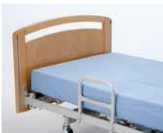
Art nr 36752 Stöd-/vändhandtag 25x30 cm