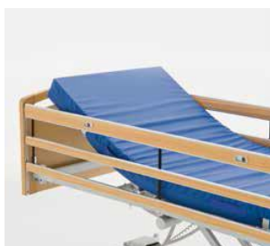
Art nr 31374 (par) Förlängd sänggrind Line fällbar (0-20 cm)