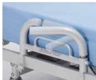
Art nr 37687 Stöd/uppresningsstöd svängbart