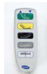
Art nr 32632 Manöverdosa Standardkomponent