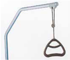
Art nr 36751 Lyftbåge med trapets