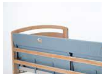
Art nr 36713 (styck) Grindskydd polstrat galon Britt V