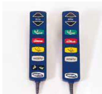
Art nr 23801 Manöverdosa Manöverdosa med lätttryckta Knappar.