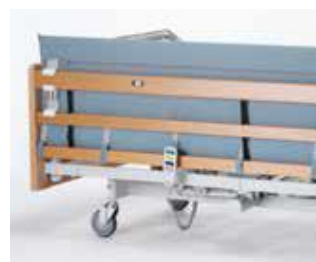
Art nr 35109 Grindskydd polstrat till sänggrind med grindförhöjning