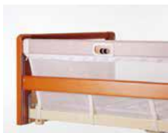
Art nr 19682 (styck) Grindskydd nät Britt III