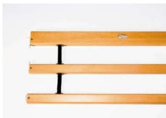
Art nr 36231 (par) Sänggrind Britt V fällbar Standardkomponent