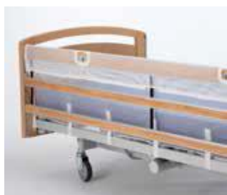
Art nr 34092 (styck) Grindskydd nät Britt V