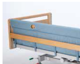
Art nr 20000 (styck) Grindskydd polstrat galon Britt III