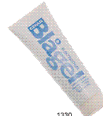
1330 10088 Elektrodgel Tac Gel, 50 g