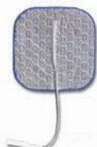
27944 Dura Stick Premium, 5x5 cm fyrkant, Blå