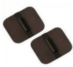
42729 Kolgummielektrod 50x50 2 pack