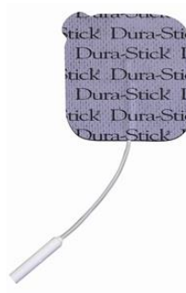
25466 Dura Stick Plus, 5x5 cm, fyrkant