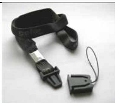
26353 Halsband o bältesclips