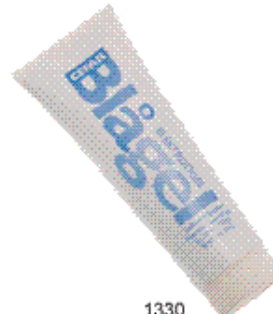
1330 10087 Elektrodgel Cefar Blågel, 250 g