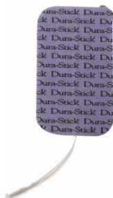
25467 Dura Stick Plus, 5x9 cm, rekt