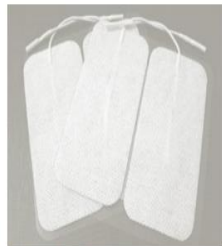
100 x 50 mm