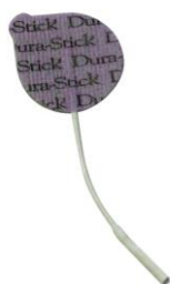
25465 Dura Stick Plus, 3,2 cm, rund 4 st/fp