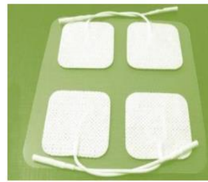
50 x 50 mm (mest vanlig)