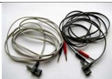
26322 Kabel, 1,3m ljusgrå+mörkgrå