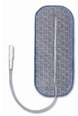
34325 Dura Stick Premium, 4x9 cm rekt, Blå Blå=för brukare med känslig hud