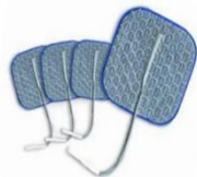
42727 Hudelektroder PALS för senOsitiv hud 50x50 4pack