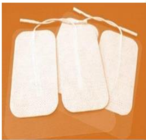
90 x 50 mm